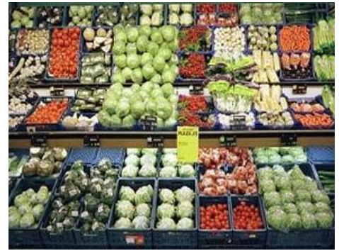
de groente- en fruitafdeling